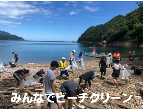
みんなでビーチクリーン